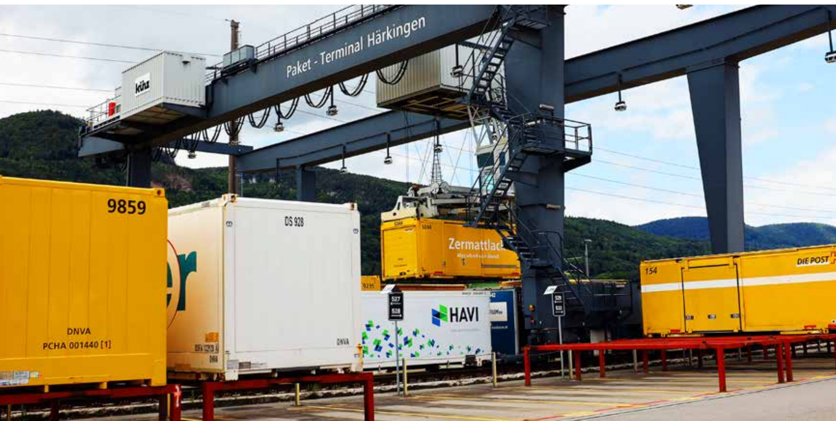
Gigantisch: Verladeterminal für den Kombinierten Verkehr. Die Dreier AG spart aber seit Jahrzehnten auch schon im Kleinen Treibstoff und CO 2 -Emissionen.

«Ökologischer»: Dieser selbst kreierte Begriff steht prominent auf der Firmen-Webseite. Damit meint die Familie Dreier die wohlüberlegte Abwägung von unternehmerischen Entscheidungen in Richtung Nachhaltigkeit. Ökologie und unternehmerisches Handeln können sich sinnvoll ergänzen: Die Dreier AG macht's vor.